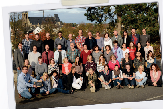
Die Lehrer der Realschule plus